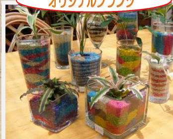
オリジナルプランツ