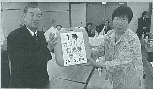
1等はエキゾチックガーデンさんでした。

5月13日(水)、第55回南伊豆町商工会通常総会を南伊豆休暇村にて開催しました。すべての議案が可決され、通常総会終了後にはお楽しみ抽選会が行われました。1等は「ガソリン・灯油券」、2等は「お肉詰め合わせ」等さまざまな景品が並ぶなか抽選番号が呼ばれ、その度に歓声やため息で大いに盛り上がりました。